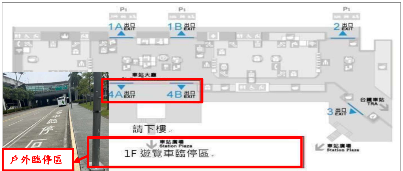
臺中高鐵接駁地點示意圖