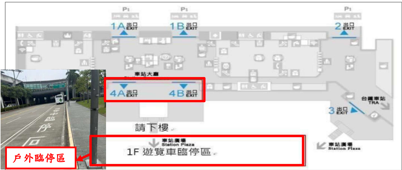
臺中高鐵接駁地點示意圖