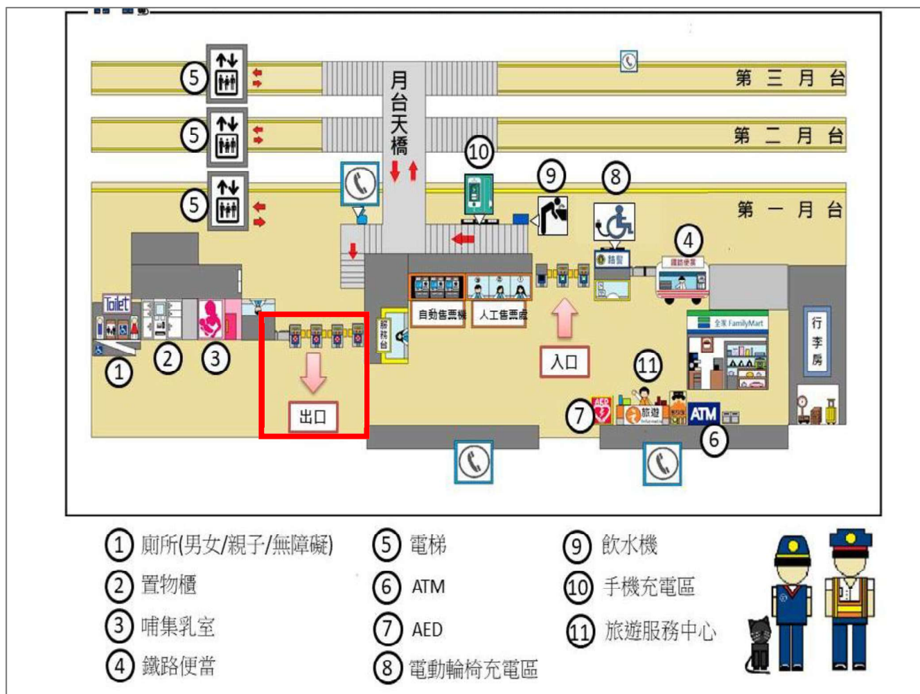
彰化台鐵接駁地點示意圖