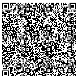
新親子綁定操作說明