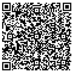
酷課 APP 懶人包