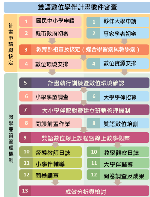
圖2 雙語數位學伴計畫實施流程