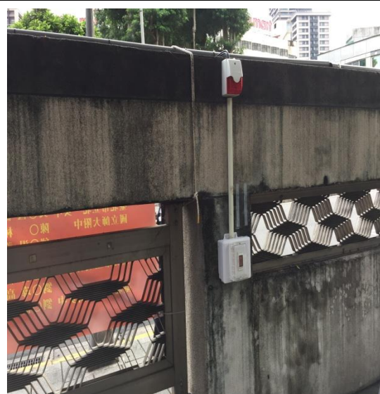
校園各處增設緊急求救鈴